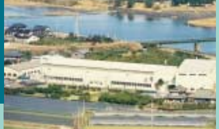
萩工場全景 射出成形機及び 自動化システム 生産