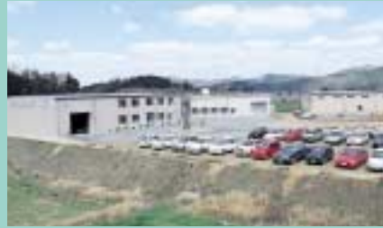
美祢工場全景 金型及び 精密部品