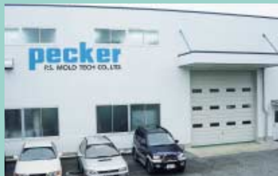
仕上・成形課第2工場