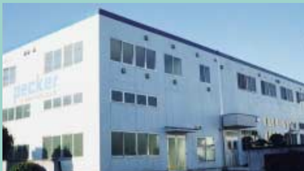
東松山本社・設計・機械課第1工場