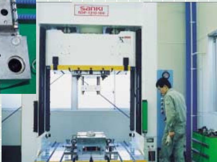
自動車関連3Dソリッドデータ使用による金型